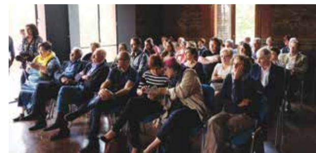
Il pubblico presente alla manifestazione.

glio, avevano espresso la necessità di poter disporre all'interno del centro stesso di un ecografo multimediale al fine di alleviare i disagi e le sofferenze di pazienti in dialisi, sia del nostro Centro che di quelli di Budrio e S. Giovanni in Persiceto i quali, per sottoporsi a particolari esami clinici fino ad ora erano costretti a recarsi presso l'Ospedale S. Orsola di Bologna.