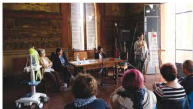
La donazione dell'ecografo multifunzionale c/o Palazzo Rosso a Bentivoglio (BO)

Inoltre, nella seduta del 29 aprile 2015 il Comitato del Distretto Pianura Est mi ha delegata a promuovere e a realizzare in tutti i 15 Comuni che lo compongono il Progetto "Una Scelta in Comune" in base al quale i cittadini che si recano in Comune per fare o rinnovare la carta d'identità hanno l'opportunità di esprimere la propria volontà a diventare potenziali donatori di organi e tessuti; a tutt'oggi quasi 4.000 persone hanno dato il loro consenso e questo fatto dimostra quanto la nuova modalità di raccolta delle adesioni sia particolarmente apprezzata dai cittadini.